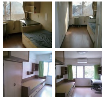
上段2枚がタイプ1、下段2枚がタイプ2の部屋です。